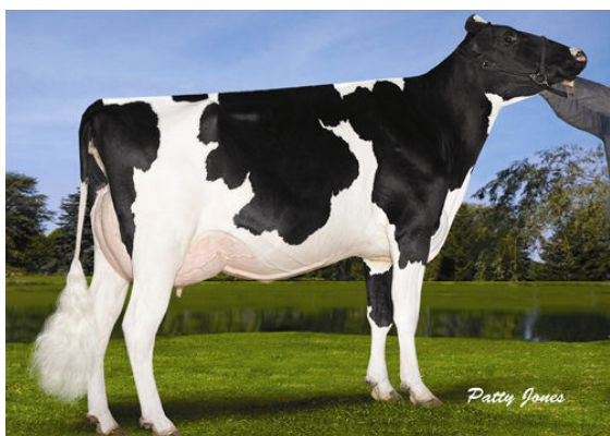
DYMENTHOLM PLANET SILKY Dam